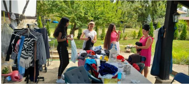
oefenen in kopen en verkopen