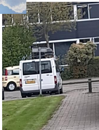
DE BUS IN DIEREN

Bravo busje... goed gedaan. Donderdagavond vertrokken; vrijdagmorgen ontbijt bij vrienden in Oostenrijk Thalgau (de eerste 900 kilometer achter de rug); laat in de avond over de brug in Vidim; een paar uurtjes slapen en vroeg in de middag in Popovtsi. Een hele ruk... braaf busje en volhardende chauffeurs. Passagiers hebben het ook volgehouden.. chapeau. Alleen hoognodige bagage eruit en bedden klaarmaken. Wat rusten, eten en niet telaar naar bed.